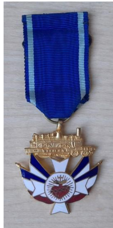
Figure 11 : Médaille de l'Association des cheminots chrétiens

Anaëlle HERREWYN, archiviste – Les Fils de la Charité