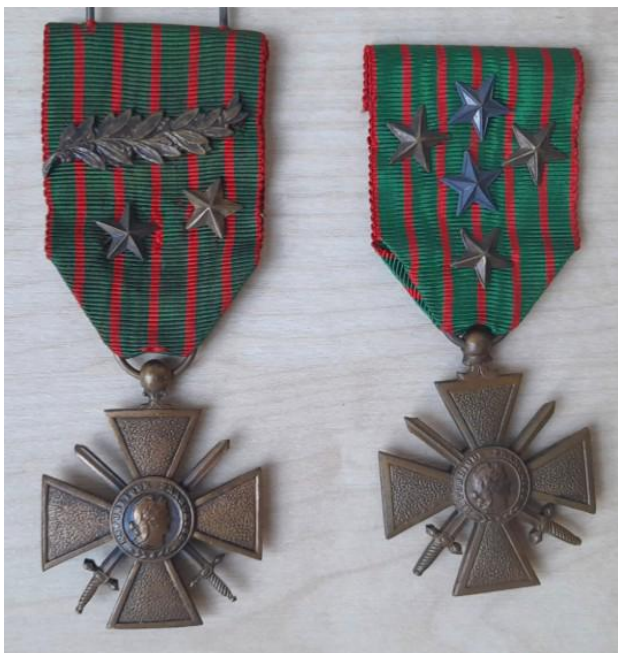
Figure 10 : Croix de guerre