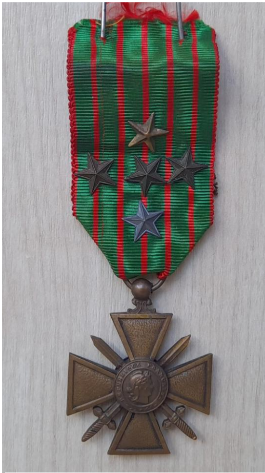
Figure 6 : Croix de guerre de Charles Devuyst

le plan physique que spirituel 28 . Ces reconnaissances officielles illustrent son rôle indispensable dans un contexte où la violence des combats met à rude épreuve le moral des hommes.