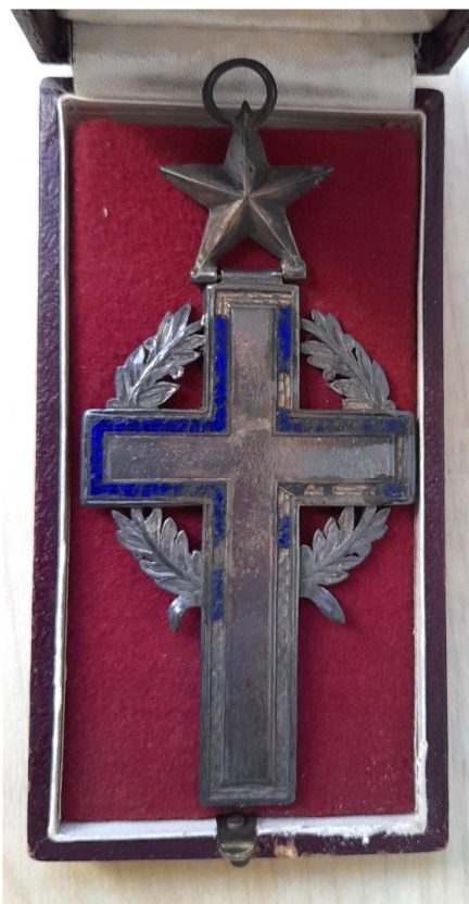
Figure 3 : Croix d'aumônier militaire de Charles Devuyt

Cette croix avait été créée sous le Second Empire par arrêté du ministre de la Guerre du 24 avril 1854 13 . Elle subit de légères modifications le 10 octobre 1874 : elle ne change pas, mais les aumôniers doivent la porter avec un cordon d'une nouvelle couleur. Il passe de vert, couleur liturgique du temps ordinaire, à un « ruban noir, liseré orange, de la largeur de 3 centimètres, conformément à la décision ministérielle du 22 novembre 1858 14 ». Ce changement aurait pu être motivé par des critiques religieuses de l'usage de cette couleur sacrée, ou, à l'inverse, par des réactions anticléricales qui y auraient vu un symbole à rejeter. La croix et le ruban sont confirmés par l'instruction du 3 novembre 1910. La croix fait 58 millimètres de hauteur sur 42 de largeur. Elle est « entourée d'un liseré de couleur bleue » et la couronne d'olivier est émaillée de vert 15 . L'état d'usure de la croix d'aumônier de Devuyt atteste qu'elle ait été portée en toutes circonstances. Le cordon n'a pas été conservé.